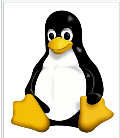
Tux, la mascotte del kernel Linux, nata mediante uno scambio di e-mail in una mailing list pubblica

Oggi molte società importanti nel campo dell' informatica come Google , IBM , Oracle Corporation , Hewlett-Packard , Red Hat , Canonical , Novell e Valve hanno infatti sviluppato e pubblicato, e continuano a farlo, sistemi Linux.